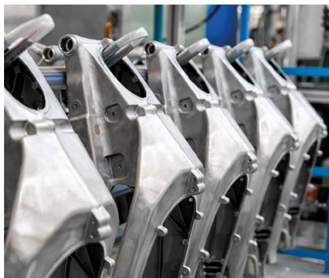
Pièces de voiture en aluminium, coulées pour l'industrie automobile